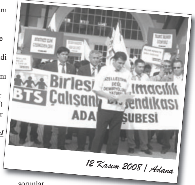
12 Kasım 2008 / Adana

Eğitim-Sen Adana Şubesi atamalarda yaşanan