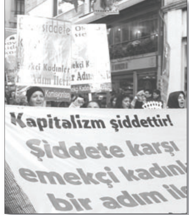
Emekçi Kadın Komisyonları , kadına yönelik cinsel baskı ve sömürüye karşı mücadele taleplerimizi birlikte yükseltmeye çağırıyor!

Emekçi Kadın Komisyonları , işçi ve emekçi kadınları örgütlü mücadeleye çağırıyor!